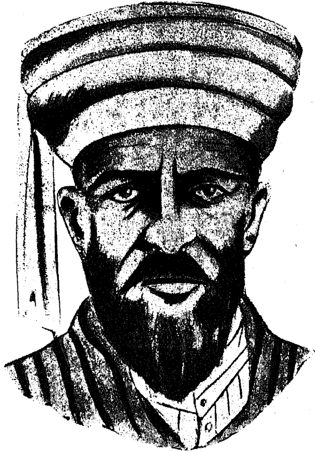
الإمام محمد يحيى حميد الدين